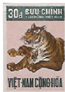
Hình Cạp được dùng trong tiền tệ và tem thư Việt Nam Cộng Hòa